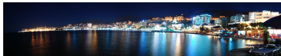
Saranda nocą to miejsce prawdziwie wyjątkowe...