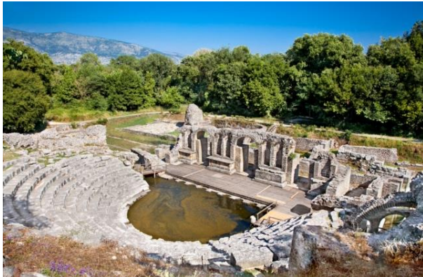
Butrint – starożytne miasto w Albanii, położone tuż przy granicy z Grecją. Cała miejscowość wpisana jest na listę światowego dziedzictwa kultury UNESCO.