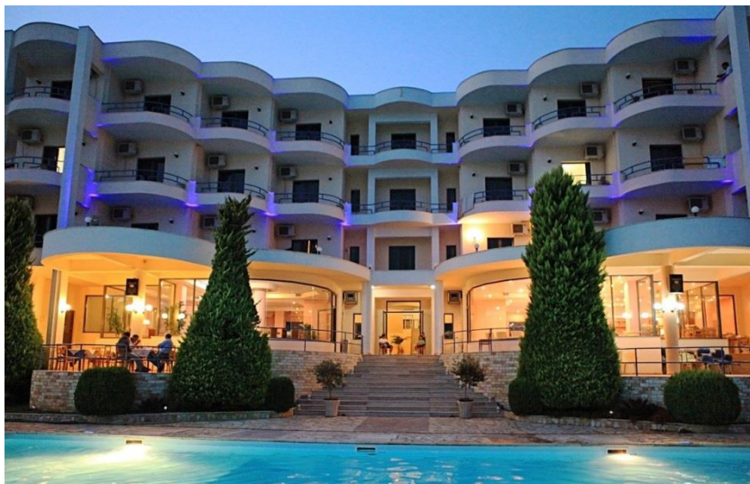
Hotel Andon Lapa w miejscowości Saranda

Zakwaterowanie w trzygwiazdkowym hotelu Andon Lapa w najmodniejszym kurorcie Albanii – w miejscowości Saranda .